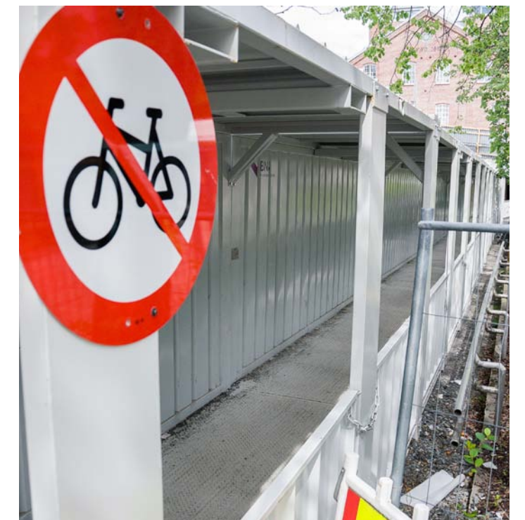
FORBUD: Sykler du gjennom gangtunnelen ved Brutorget og Arnemannsveien, risikerer du å bli bøtelagt.