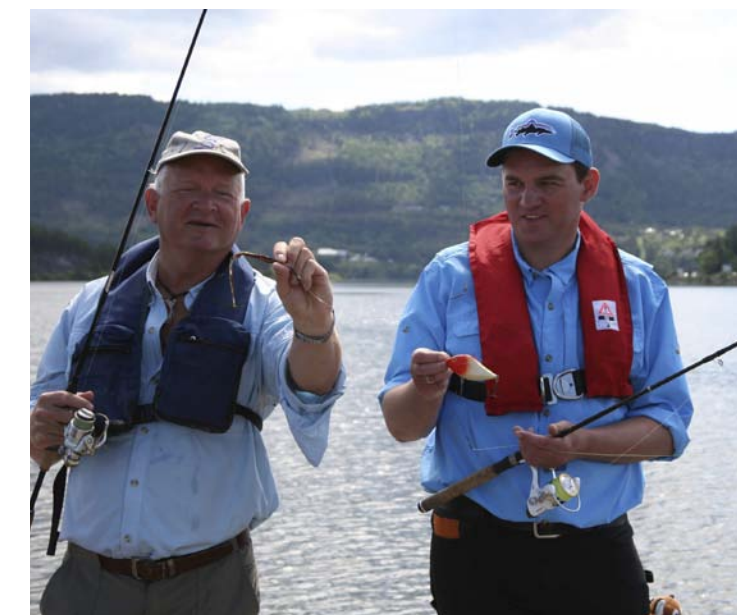
LOKKER GJEDDE: Det går i sluk og forsterket sene når det fiskes etter gjedde.

– Og det er et stort marked. Det bor 80 millioner i Tyskland, og av disse er det mellom 1 og 2 millioner fiskere.